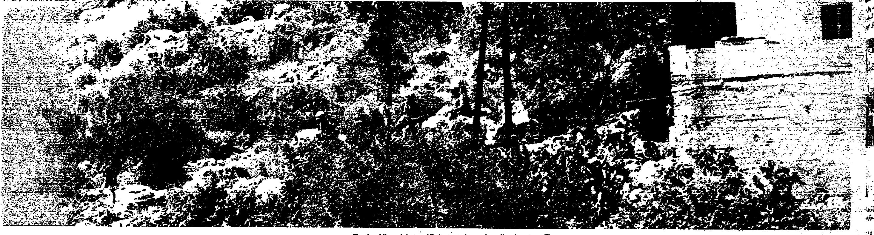
■ بعض جنود العدو لدى مغادرتهم « عين الشب » لطريق الانسحاب